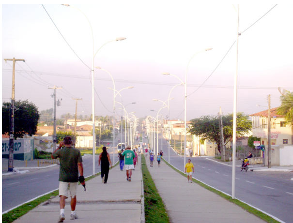
Imagem 05: Pista de caminhada – zona urbana